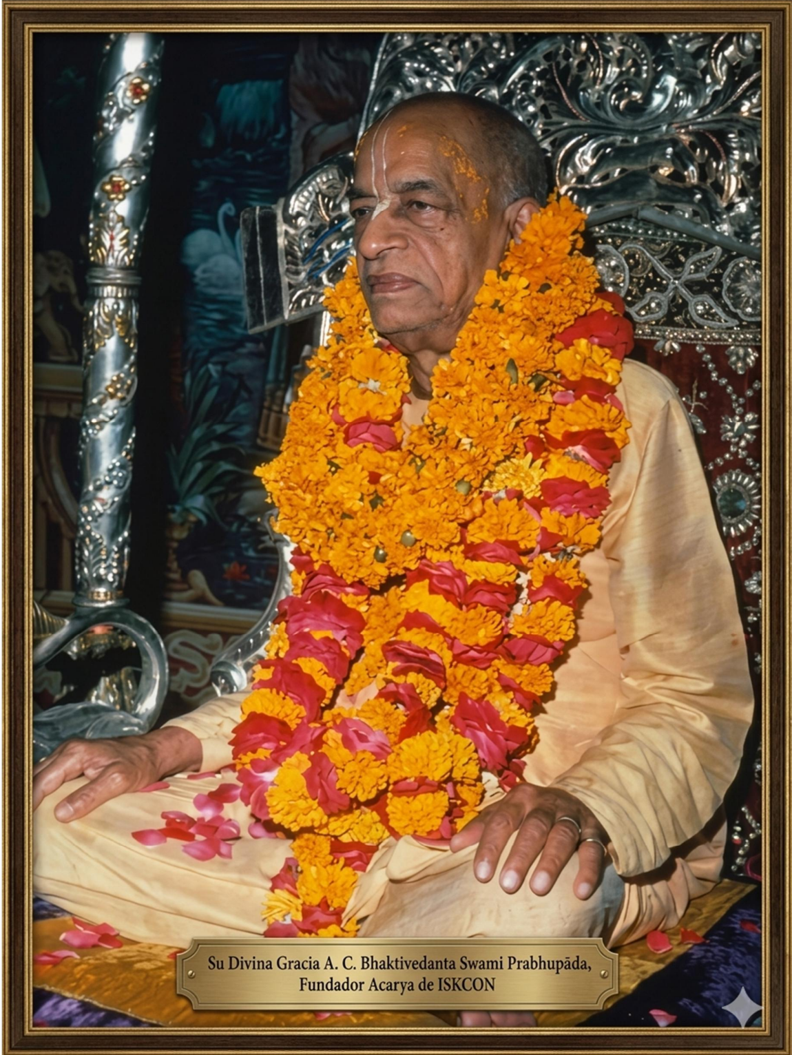
Su Divina Gracia A. C. Bhaktivedanta Swami Prabhupāda, Fundador Acarya de ISKCON